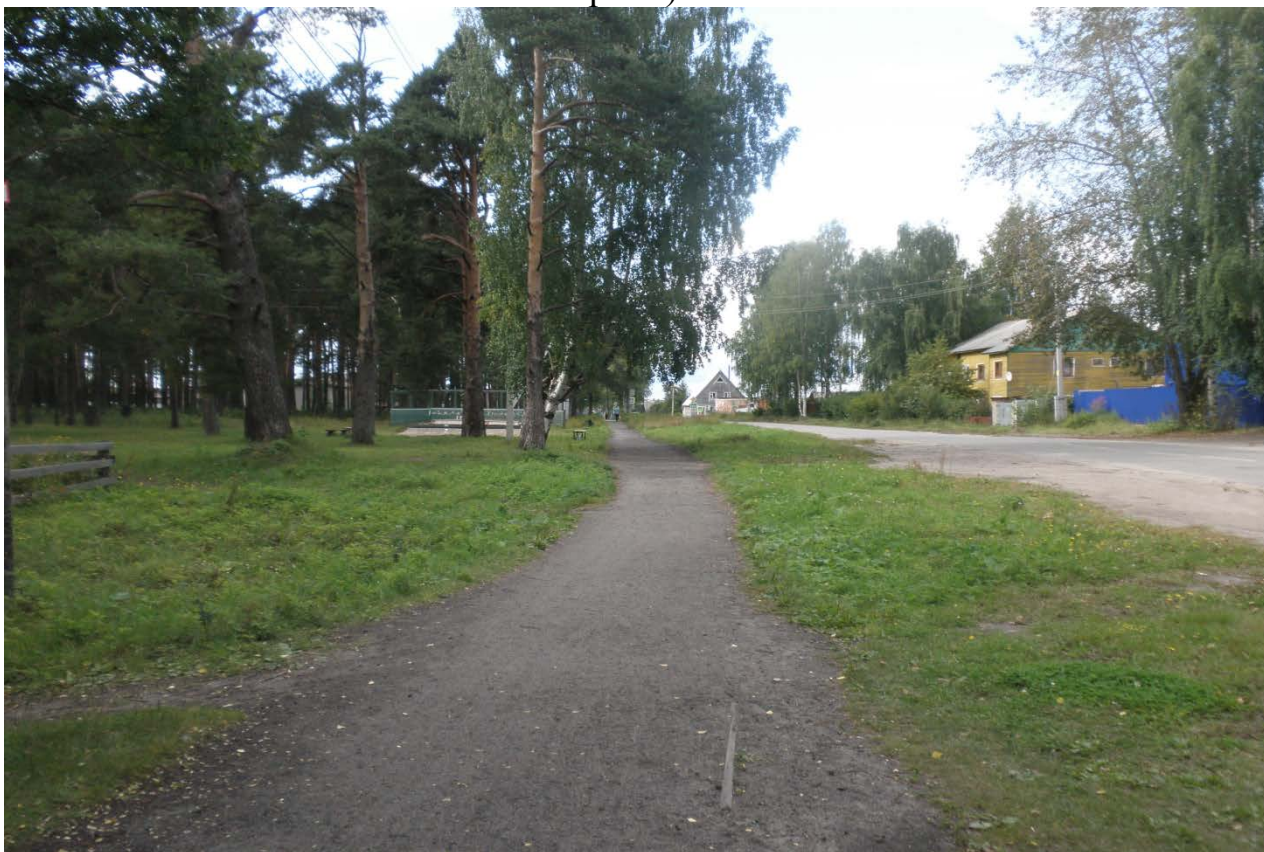
Фото общественной территории г. Шенкурск, ул. Кудрявцева (настоящее время)