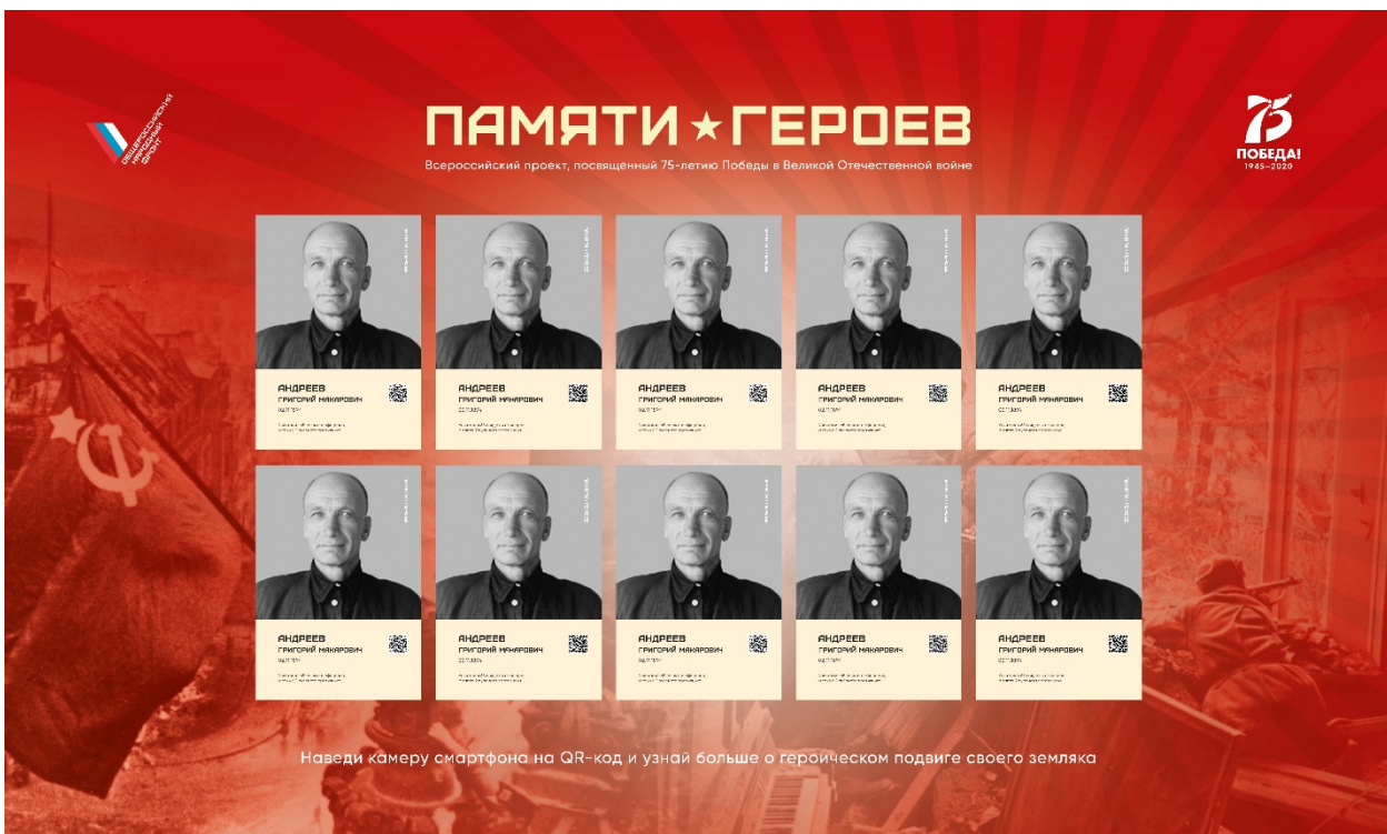
Рис. 5. Тематический стенд, на котором ежемесячно обновляется информация о героях