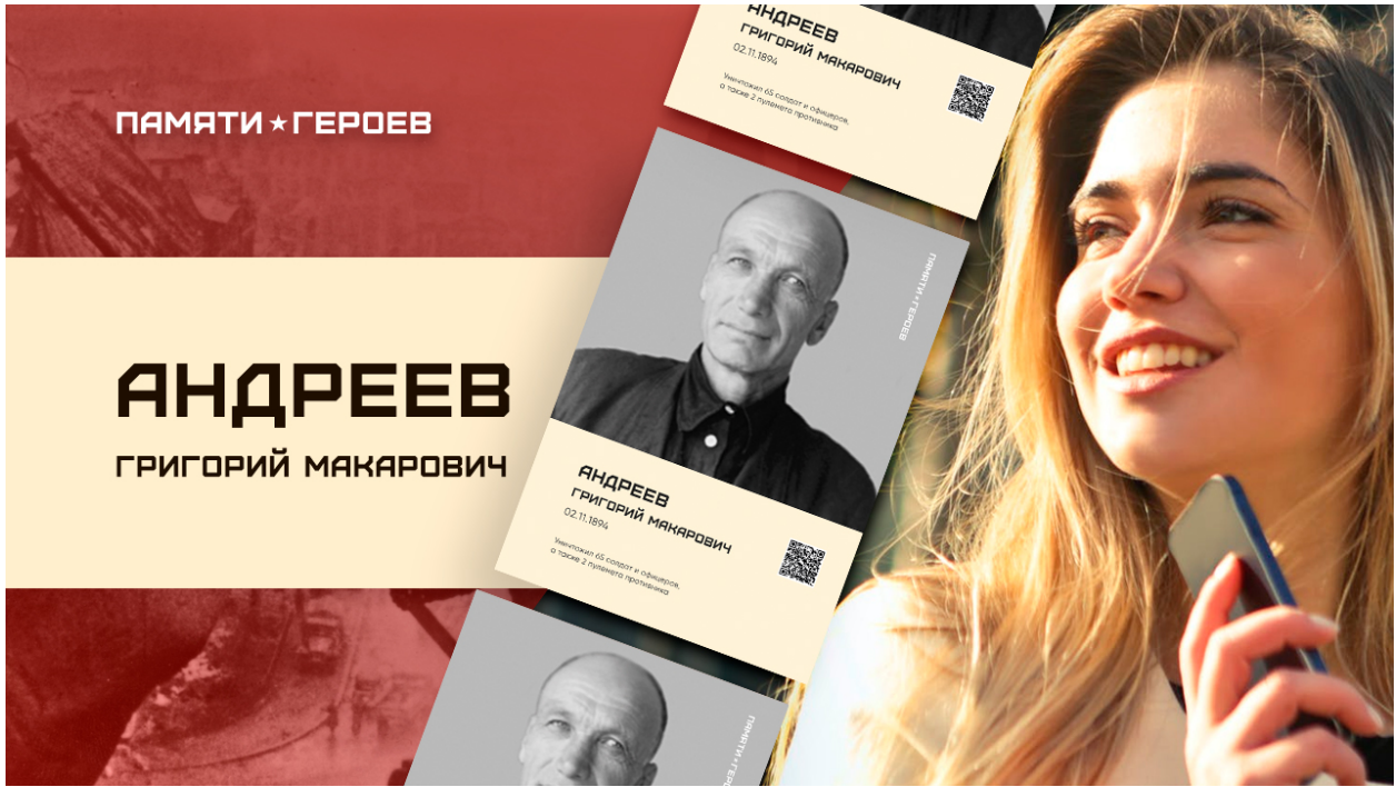
Рис. 3. Образец превью на загружаемый ролик о Герое. Шаблон .psd во вложении.