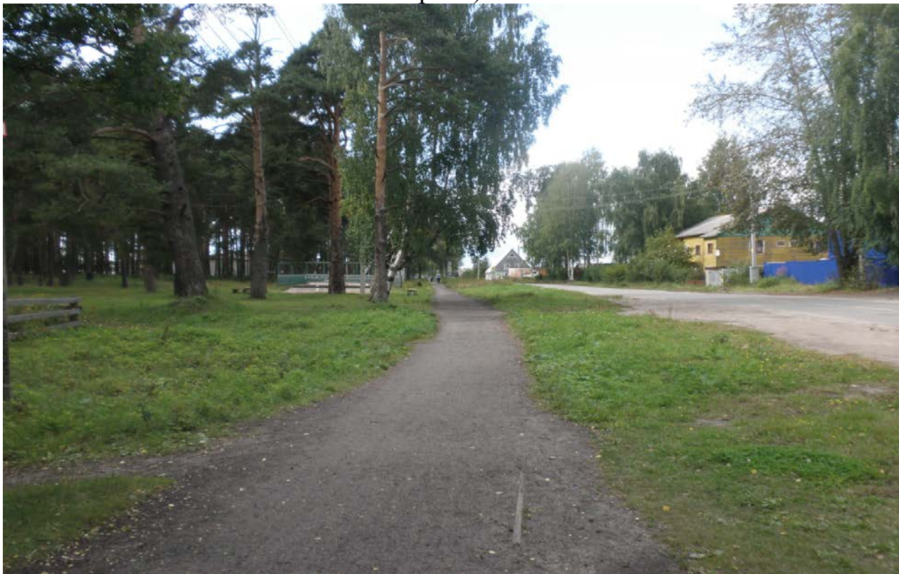
Фото общественной территории г. Шенкурск, ул. Кудрявцева (настоящее время)