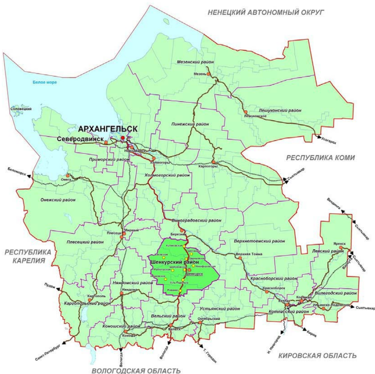
Рисунок 1. Местоположение Шенкурского муниципального района в системе муниципальных образований Архангельской области

Шенкурский район приравнен к районам Крайнего Севера.