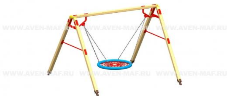
Рис. 2 Качели маятниковые