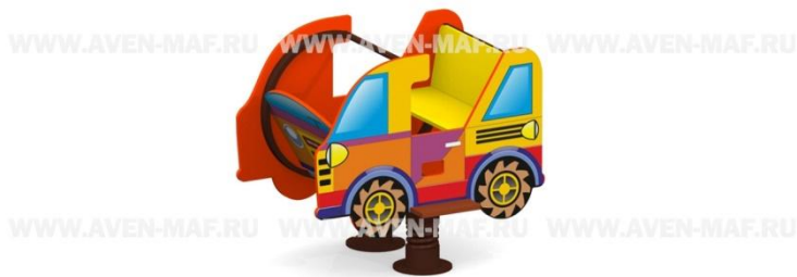
Рис. 4 Качалка на пружине