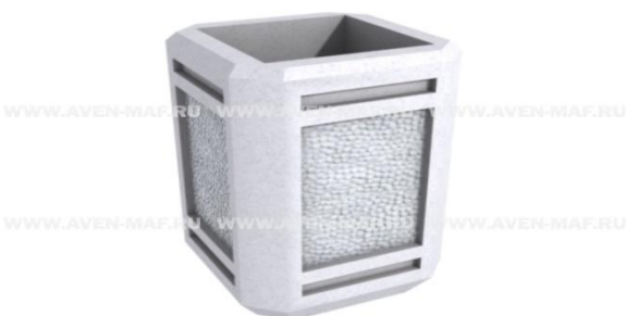
Рис. 8. Бетонная урна для мусора