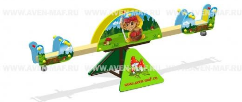
Рис. 3 Качели балансир