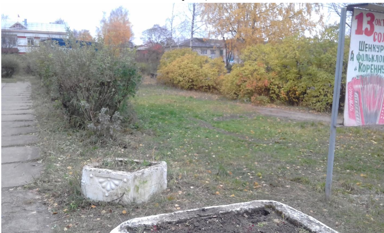
Фото общественной территории г. Шенкурск, площадь Победы (настоящее время)