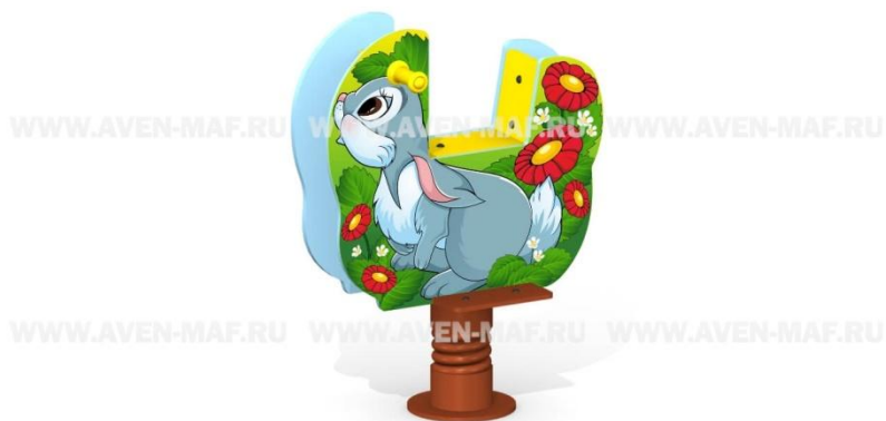
Рис. 5 Качалка на пружине