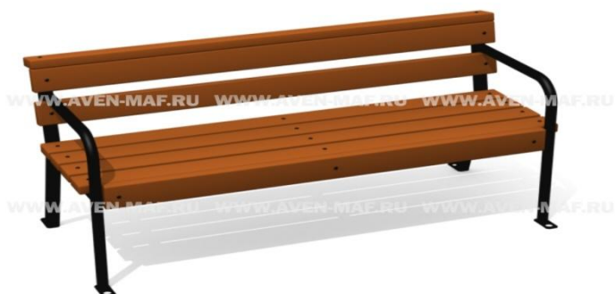
Рис. 1 Скамья садово-парковая на металлическом каркасе