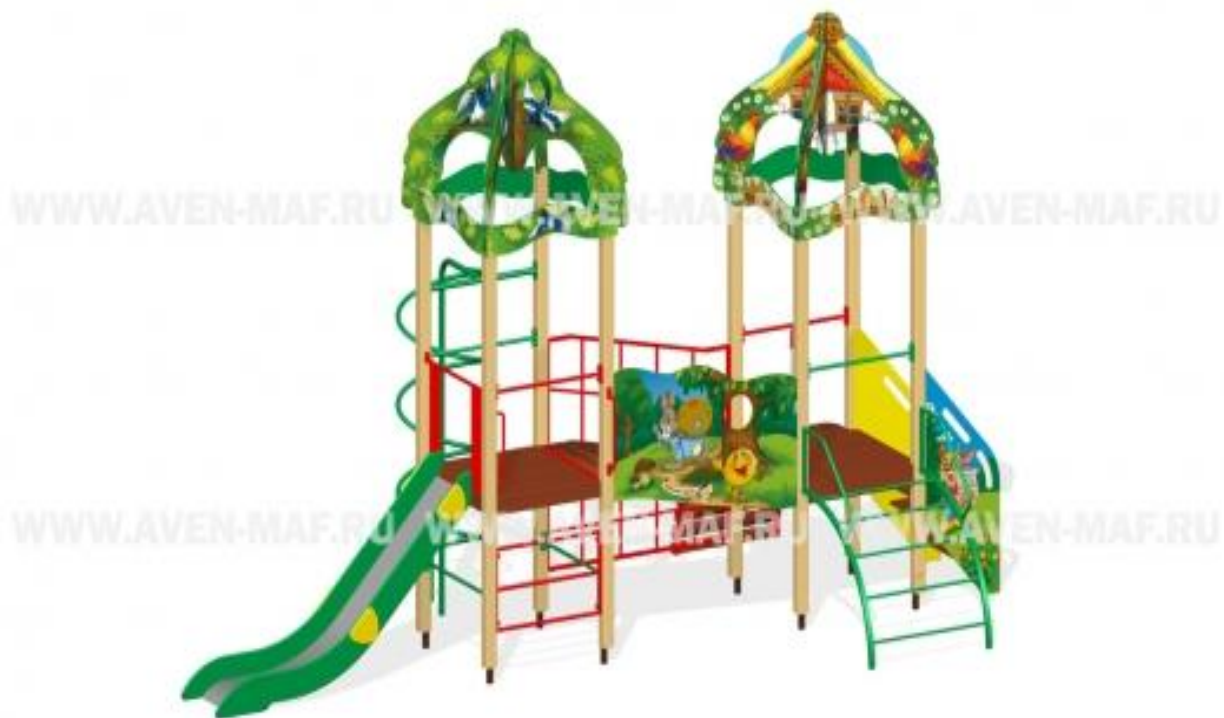
Рис. 7. Детский городок