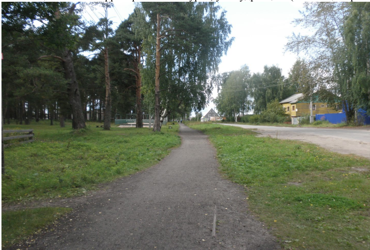
Фото общественной территории г. Шенкурск, ул. Кудрявцева (настоящее время)